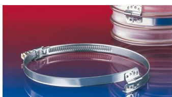
スパイラルホースクランプ: 212