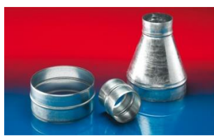
メタルコネクター: 270-271