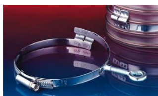
アイレット付クランプ: 217