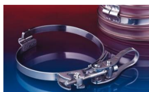
クイッククランプ: 213