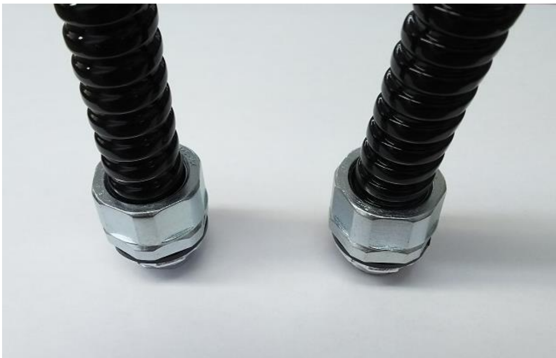
フラット部分 有りタイプ