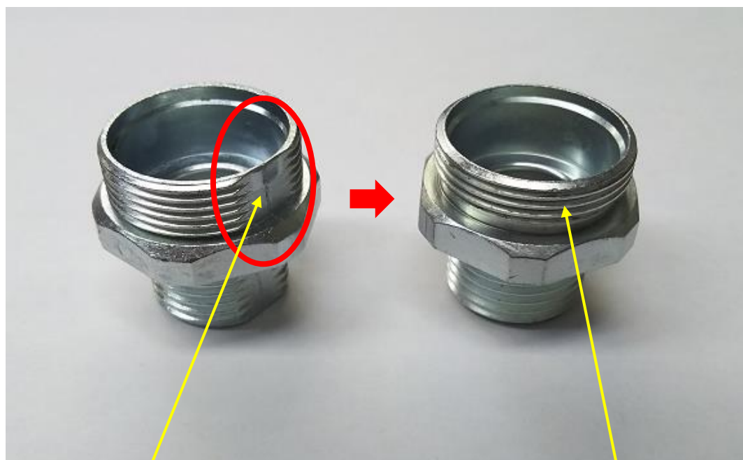
フラット部分 有りタイプ